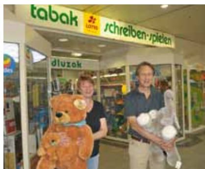
Ein letzter Blick auf die alte Front, die nunmehr bald Geschichte ist.

Der Betrieb geht selbstverständlich auch während des Umbaus ungehindert weiter, denn eine Schließung kommt selbstredend nicht in Frage. Zu beliebt ist bei den Kundinnen und Kunden das große vielfältige Angebot an Spielwaren, Büchern,