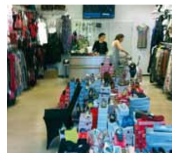
So wird sich DuDu Moda auch bald im Einkaufscenter Jenfeld den Kundinnen präsentieren, wir freuen uns drauf

Die Kundinnen erwarten sodann topaktuelle Mode zu fairen Preisen, angefangen vom passenden Schuh bis hin zum passenden Accessoire, ob Gürtel, Tasche und Co. DuDu Moda bietet für jeden Geschmack das Passende. Das genaue Eröffnungsdatum erfahren Sie in der nächsten Shopping News oder aber unter www.ekz-jenfeld.de