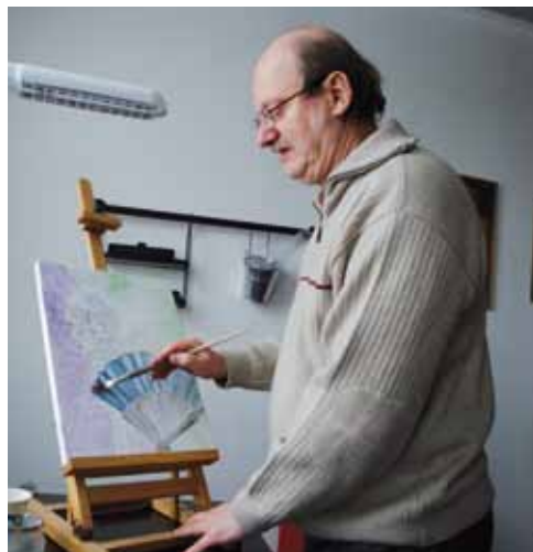
Der Künstler bei der Arbeit

Ich male vor allem gegenständlich und ich versuche, meine Arbeit durch neue Maltechniken und Materialien weiterzuentwickeln. Dabei interessieren mich Gegensätze, wie zum Beispiel Licht und Schatten, die sich in ihrer Wirkung gegenseitig verstärken.