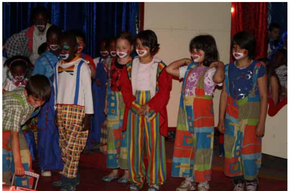
Vollste Konzentration vor dem Auftritt.