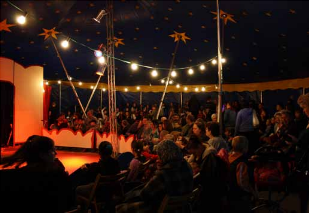
Die Zuschauer warten gespannt auf die Artisten

„Vorhang auf und Manege frei für die Jenfelder Kinder“ hieß es eine ganze Woche lang für die Kinder der Grundschule Öjendorfer Damm und der Arche. In der Woche vom 23. – 27. Mai 2011 schlug der Mitmachzirkus „Zaretti“ sein buntes Zelt auf dem Gelände der Arche auf. Durch die Kooperation der Grundschule Öjendorfer Damm mit der Arche konnten rund 200 Kinder unter professioneller Anleitung bei regelmäßigen Proben ihre Talente entdecken und in die Zirkuswelt eintauchen. Morgens fanden die Proben der Schulklassen, mittags die der Arche-Kinder statt, bei denen die Räumlichkeiten der Arche zusätzlich genutzt wurden.