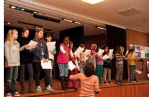
Die Jenkitos beim Proben

Kindermusical der Jenkitos wird aufgeführt