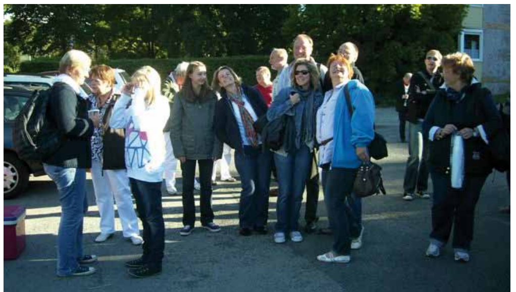
Die Jenfelder Volksspielbühne auf ihrem gemeinsamen Ausflug