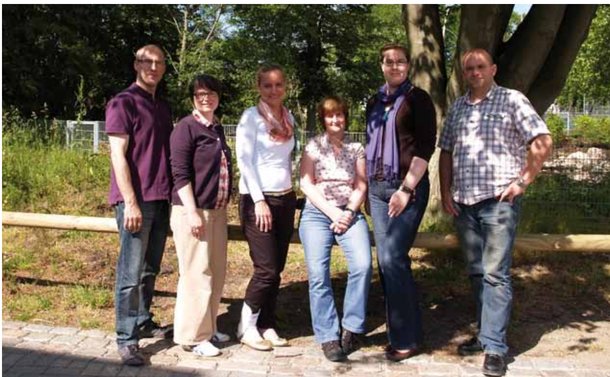
Licht und Schatten: Das neue JenZ-Team bald ohne „Rand“