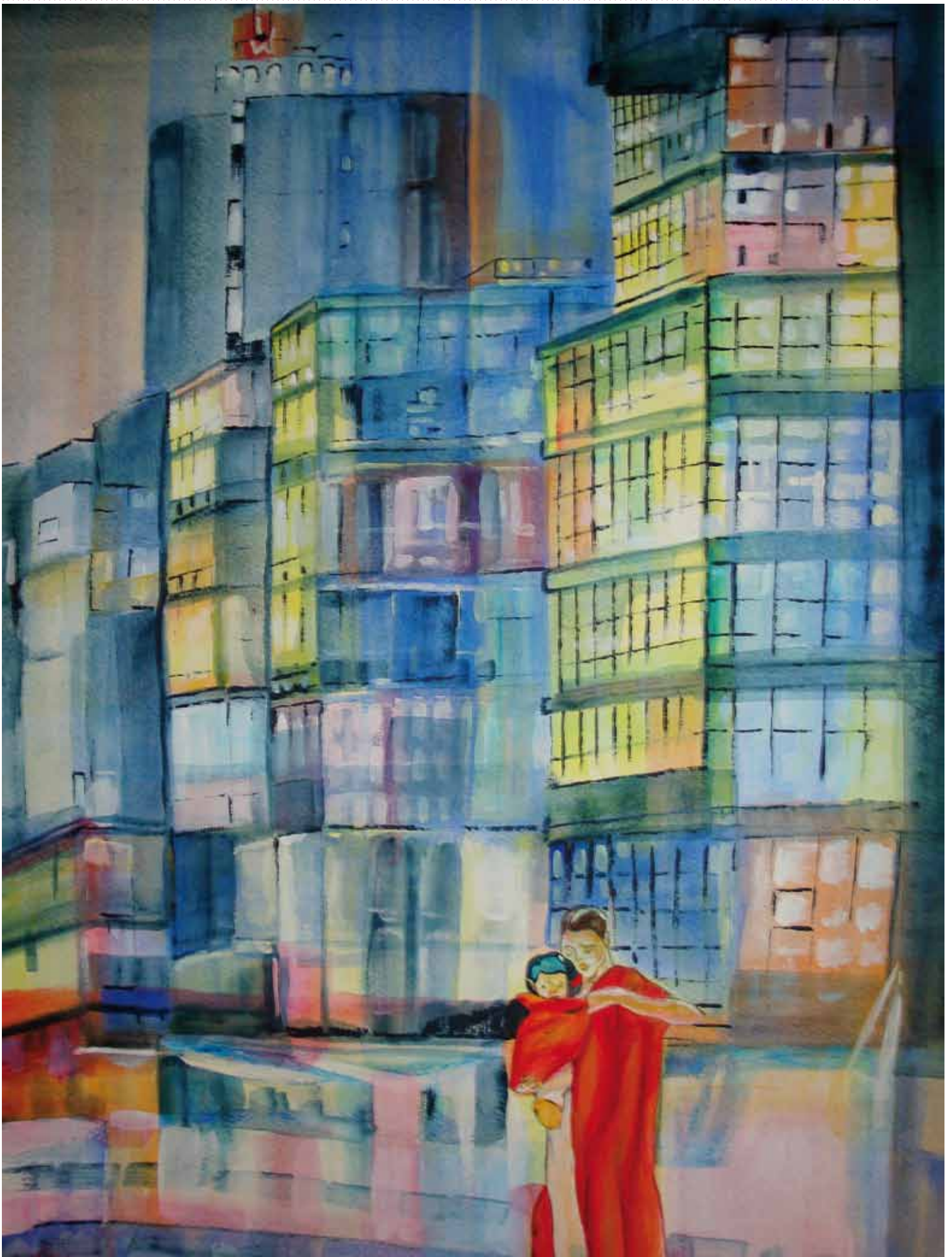
Günther Wunderlich: Leben in der Hafencity , Acryl auf Papier, 2009