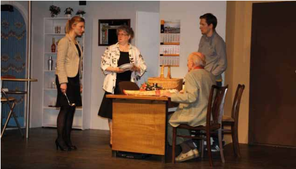
Die Jenfelder Volksspielbühne in Aktion